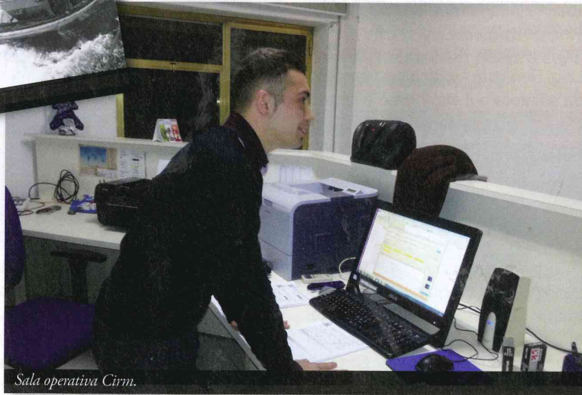
Sala operativa Cirm.